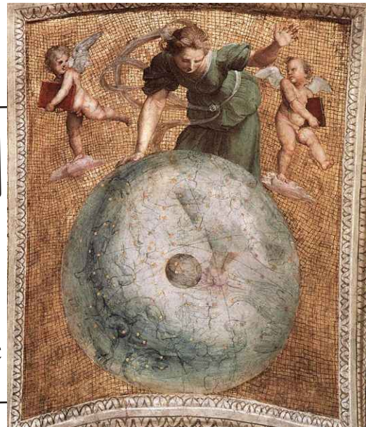
|Rafael-Primul mișcător-Stanza della Segnatura

Probabil doar amatorismul nostru în a întreprinde o cercetare ne-a făcut să obținem răspunsuri atât de puține. Probabil nu am scufundat sonda unde trebuia sau cum trebuia. Nu știu exact, dar la un feed-back nu renunțăm așa ușor. Așa ca fiți pregătiți!