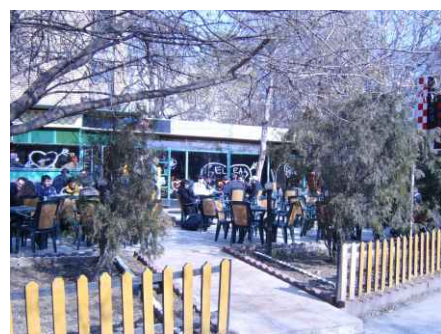
La terasa Lucky-grupele de filosofi