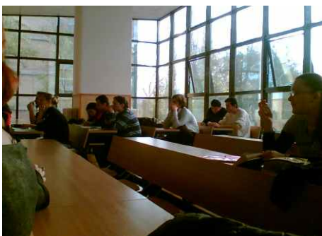
Amfiteatrul populat la început de semestru