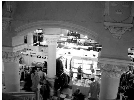
Palatul culturii din Iași -buticuri de toamnă-iarnă

- către cei căzuți pe gânduri: nu am vrut să prezint un Iași urât deși tare mi-e teamă că l-am caricaturizat (îmi cer scuze dacă asta considerați a fi rezultatul)