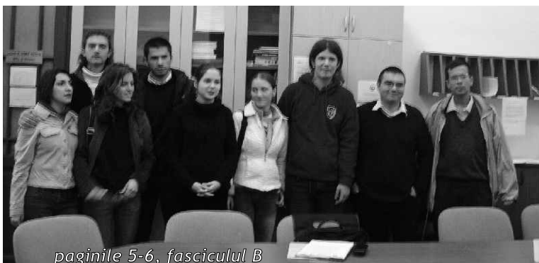
paginile 5-6, fasciculul B

Asociația Studențească pentru Filosofie și Societate